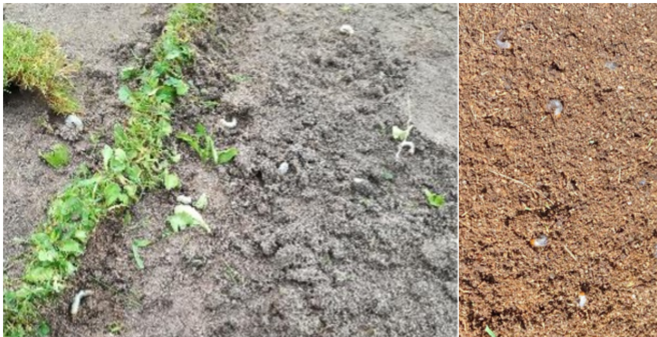
Kuva 5. Kun nurmikkoja uusitaan tai paikataan golfkentillä, pintamaasta usein paljastuu turilaiden toukkia.

vehtimaan. Keväällä ne koteloituvat, ja touko-kesäkuussa kehittyvät uusia aikuisia.