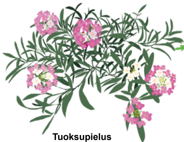
Tuoksupielus Lobularia maritima Kukinta: kesä–syyskuu

Parhaat kasvilajit, jotka kukkiessaan houkuttelevat ja tarjoavat ruokaa loispistiäisille ja monille muille luontaisille vihollisille. Eniten auttaa sellainen seos, minkä kukkajatkumo kestää mahdollisimman pitkään. Monet näistä auttavat myös pölyttäjähyönteisiä.