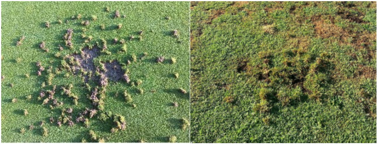
Kuva 7. Lintujen aiheuttamia vaurioita golfkentän viheriöllä Pohjois-Jyllannissa Tanskassa (vasemmalla) ja Etelä-Suomessa (oikealla).