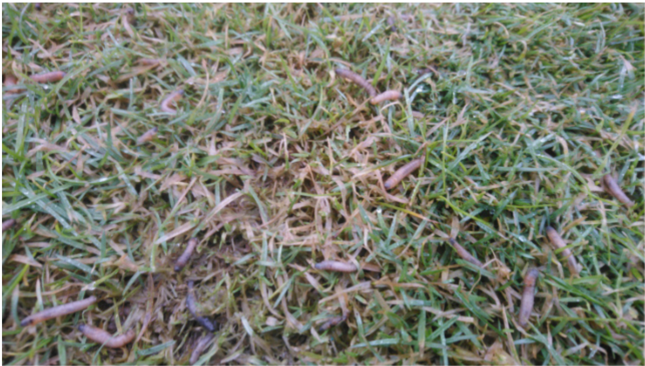
Kuva 11. Vaaksiaisten ja karvasääskien toukkia aikaisin keväällä golfkentällä Suomessa.