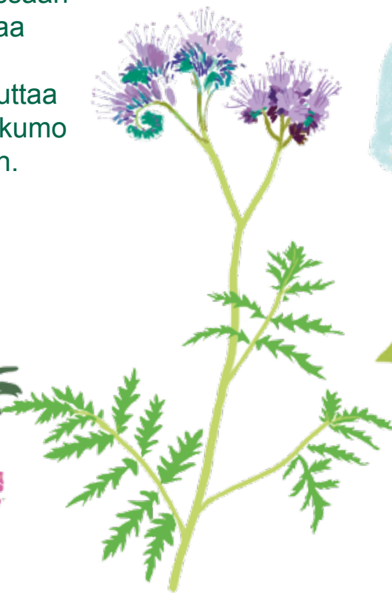
Hunajakukka Phacelia tanacetifolia Kukinta: kesä–elokuu