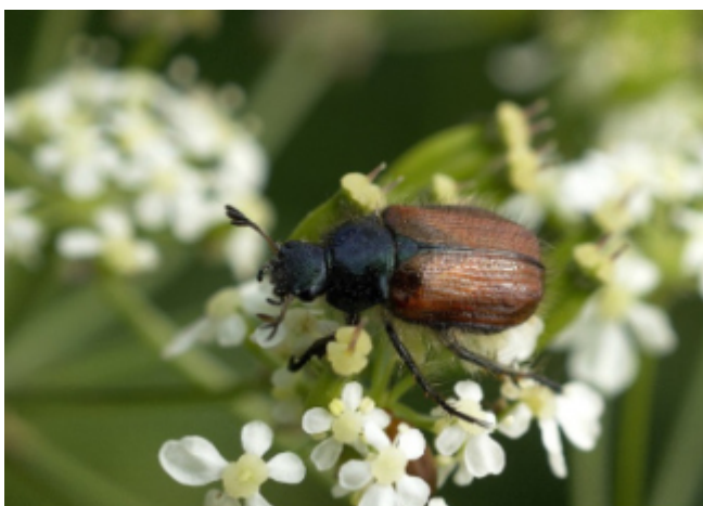
Kuva 4a. Tarhaturilas, aikuinen.

Tärkein golfkentillä esiintyvä laji on tarhaturilas. Sitä esiintyy kaikkialla Euroopassa, pääasiassa siellä, missä nurmikkoa leikataan. Tämän lajin sukupolven pituus on yksi vuosi. Aikuinen kovakuoriainen on noin 8–12 mm pitkä. Siivet ovat ruskeat, pää ja keskiselkä metallinvihreitä (kuva 4). Toukkuun lopusta kesäkuun puoliväliin aikuiset kovakuoriaiset ("kesäkuukuoriaiset") parveilevat aivan nurmikon yläpuolella keskellä päivää. Niitä tavataan kaikentyyppisillä nurmikoilla – golfkentillä useimmiten väylillä, mutta jotkut kentänhoitajat kertovat, että ne parveilevat myös viheriöillä. Heti parittelun jälkeen naaraat kaivautuvat maaperään 10–15 cm syvyyteen, johon ne munivat. Yksi turilasnaaras munii noin 50 munaa. 6–7 viikon kuluttua kehittyvät pieniä toukkia, jotka käyvät läpi 3 toukkavaihetta. Ensimmäisessä vaiheessa ne ovat 1–2 mm pituisia ja syövät orgaanista ainesta maaperässä. Toisessa vaiheessa ne alkavat syödä heinien juuria, ja kolmannessa vaiheessa (tyypillisesti elokuussa) toukat ovat noin 20 mm pituisia, valkoisia, ruskeapäisiä, ja tyypillisesti C-muotoisia (kuva 4). Tässä vaiheessa ne tekevät eniten vahinkoja nurmialueille. Myöhemmin syksyllä toukat kaivautuvat syvemmälle maaperään, jonne ne jäävät tal-