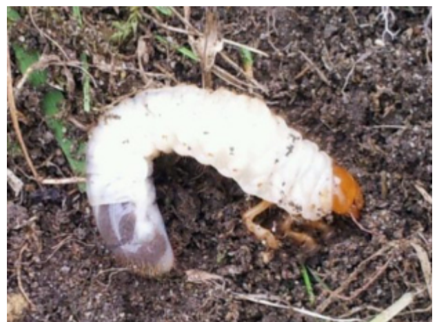
Kuva 4b. Tarhaturilaan toukka.