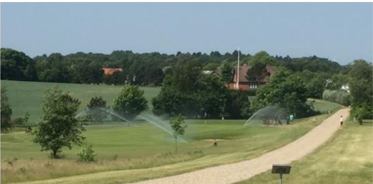
Kuva 13. Sadetusta keskipäivällä Viborg Golf Club -kentällä Tanskassa, tavoitteena estää tarhaturilaisia munimasta viheriöille. kesäkuu 2018.

taan) illalla, jonka jälkeen alue peitetään heti vahvalla muovikatteella (kuva 12, vasemmalla). Aamulla kate poistetaan ja pintaan nousseet toukat (kuva 12, oikealla) haravoitetaan, harjataan tai lapioidaan pois ennen kuin ne kaivautuvat talkaisin maahan. Toimenpiteen voi toistaa muutamana iltana, jolloin myös pitäisi havaita toukkien määrän vähenemisen. Menetelmää pidetään tehokkaana, mutta työläänä.