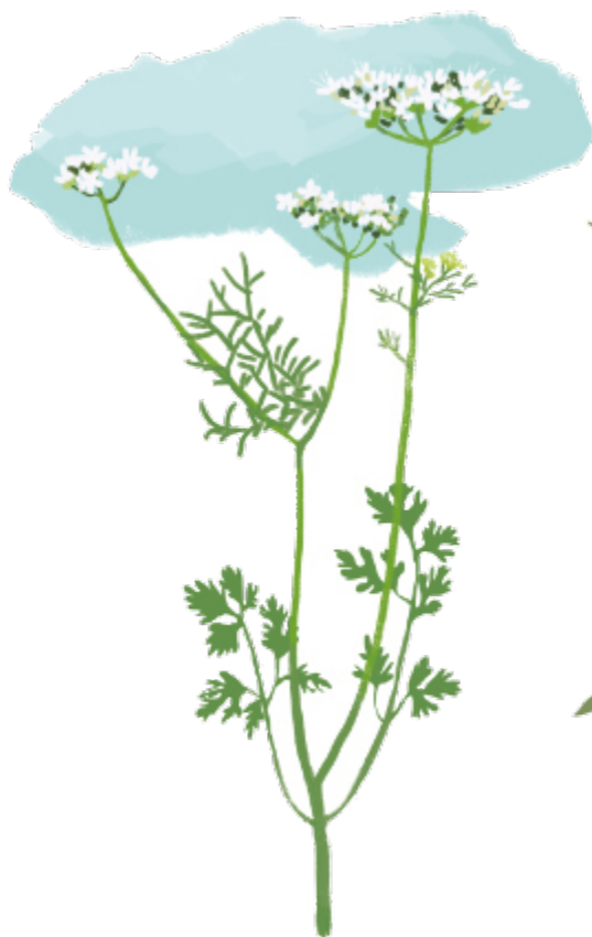
Korianteri Coriandrum sativum Kukinta: kesä–syyskuu