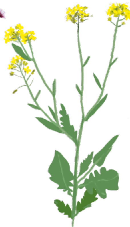
Rypsi, rapsi, sinappi Brassica spp. Kukinta: kesä–elokuu