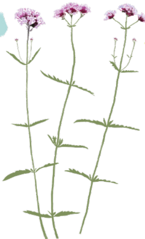
Rautayrtit Verbena spp. Kukinta: touko–lokakuu