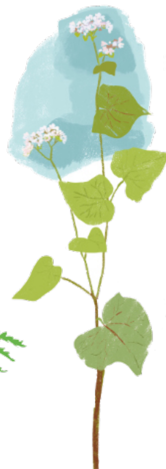
Tattari Fagopyrum esculentum Kukinta: heinä–elokuu