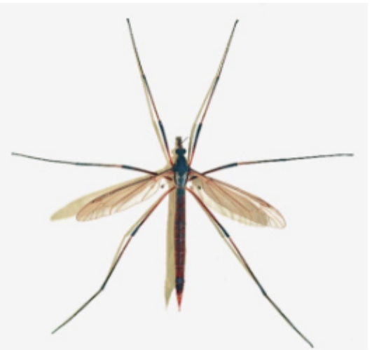
Kuva 1. Vaaksiaisen toukka vasemmalla, aikuinen pihakaalikirsikäs oikealla.