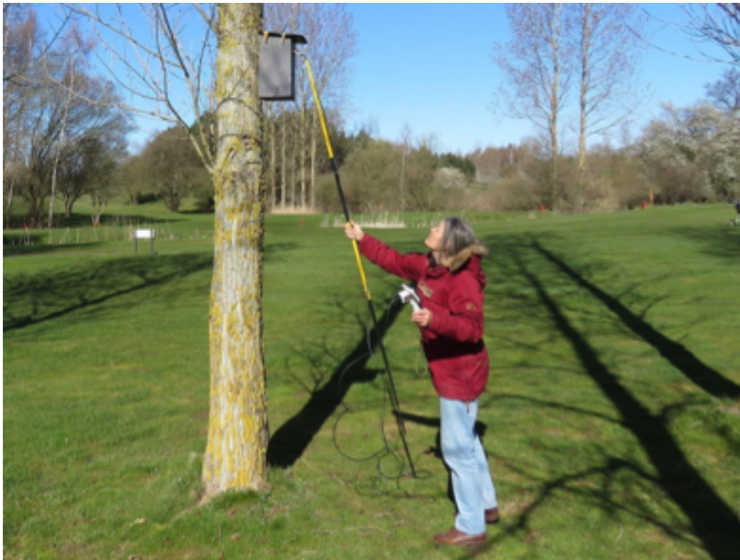
Kuva 9. Linnunpönttöä tarkastetaan Sydsjællands Golfclub -kentällä kurkistuskameran avulla.

ympäristöissä yleisesti. Tämä osoittaa, että golfkenttä tarjoaa kottaraiselle riittävät olosuhteet onnistuneiden pesueiden tuottamiseen.