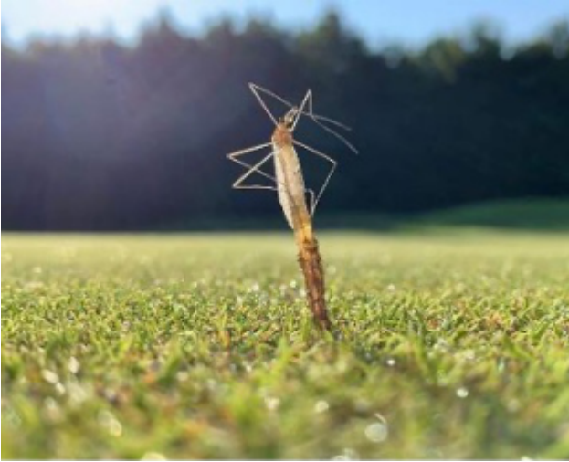
Kuva 2. Vaaksiainen aikuistumassa kotelovaiheesta. Lyngbygaard Golf Club, 5. elokuuta 2021.

ras voi munia 300–800 munaa munintakauden aikana. Kahden viikon kuluttua munista kuoriutuu pieniä toukkia.