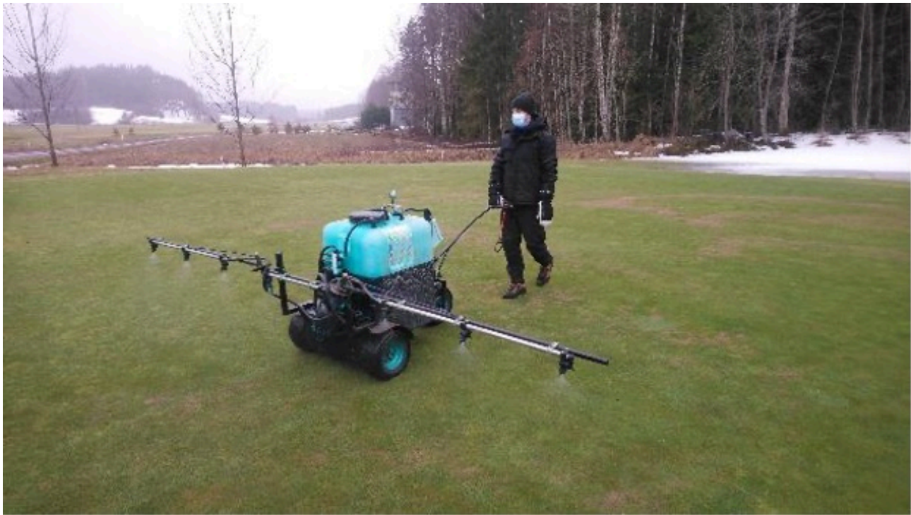
Kuva 10. Aikainen kevättorjunta sukkulamadoilla golfkentällä Suomessa, maaliskuu 2021.