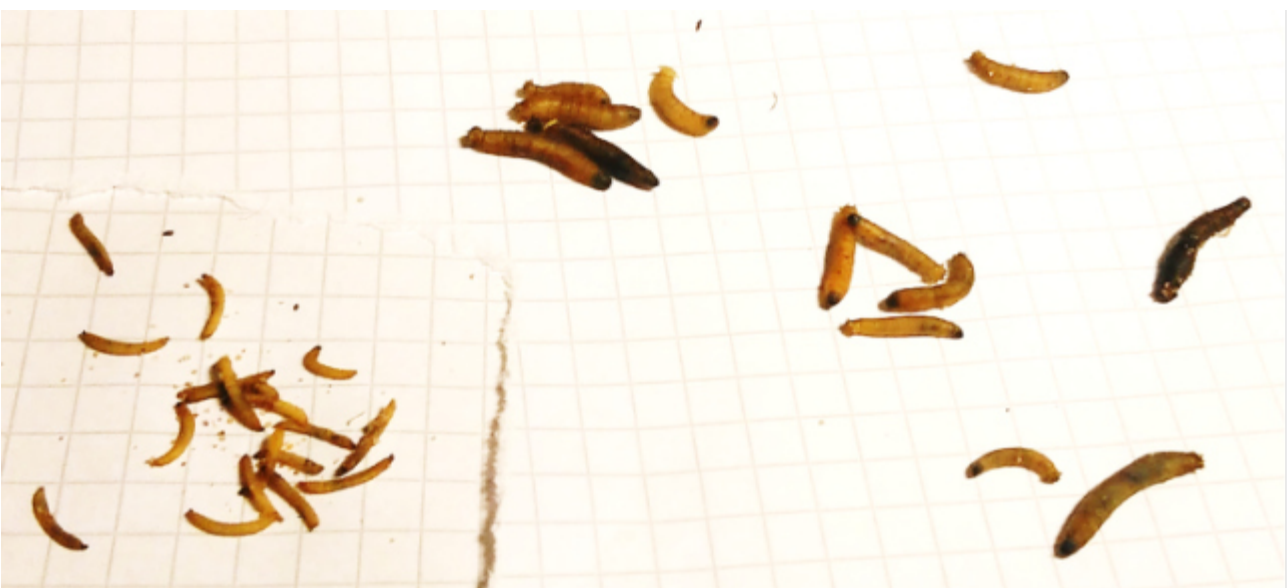
Kuva 3. Karvasääskien toukkia vasemmalla, vaaksiasten toukkia oikealla. Vaaksiasten toukat ovat sileitä, karvasääskien toukat karvaisia.

Suomessa kentänhoitajat mainitsevat vaaksiaiset yleisimpänä hyönteisongelmana golfkentillä. Kentänhoitajien keskuudessa vuonna 2021 tehdyssä kyselyssä 45 % ongelmista raportoineista ilmoitti vaaksiaiset tärkeimmiksi tuholaisiksi (henkilökohtainen tiedonanto: Heikki Hokkanen, Aasatek Oy). Koska hyönteislajistoa tunnetaan puutteellisesti, mukana on todennäköisesti useita muitakin lajeja. Karvasääskien (Bibionidae) toukkia esiintyy yleensä yhdessä vaaksiasten toukkien kanssa (kuva 3), tai yksinään.