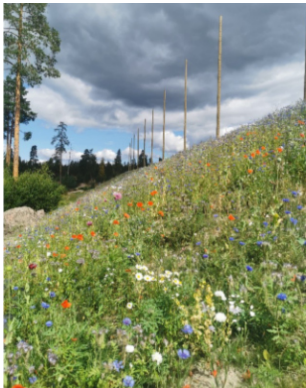
Kuva 8. Kukkaniitty Hirsalan golfkentän laidalla Kirkkonummella. Kukkivat kasvit tuottavat ravintoa (siitepölyä, mettä) hyötyhyönteisille kuten loispistiäisille ja pölyttäjille, sekä tarjoavat suojapaikkoja.

Suojapaikkoina voivat toimia monenlaiset pienet kolot, joita golfkenttämäärästä usein löytyy. Talvehtimipaikkojen tulisi olla suojaisia eikä esimerkiksi jäädä tulvaveden alle. Rinteet ovat monille mieluisia talvehtimipaikkoja (kuva 8). Kivikasat ja karheikot