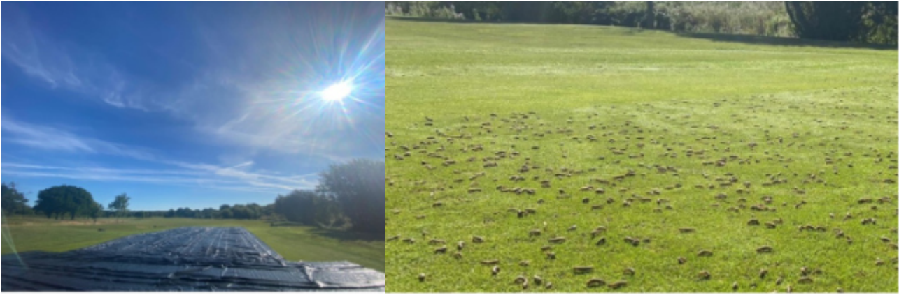
Kuva 12. Tulvittamisen jälkeen illalla vaaksiaisten vaivaama ongelma-alue peitetään vahvalla muovilla (vasemmalla). Seuraavana aamuna kate poistetaan (oikealla) ja vaaksiaisten toukat poistetaan. Etualalla kate on ollut nurmikon päällä, taustalla katetta ei ole ollut.